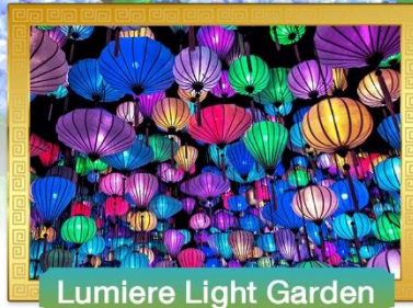
Lumiere Light Garden