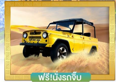
ฟรี!นั่งรถจี๊ป