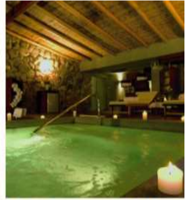
RIO SAGRADO, A BELMOND HOTEL, SACRED VALLEY AN OASIS RICH WITH THE SPIRIT OF THE INCAS