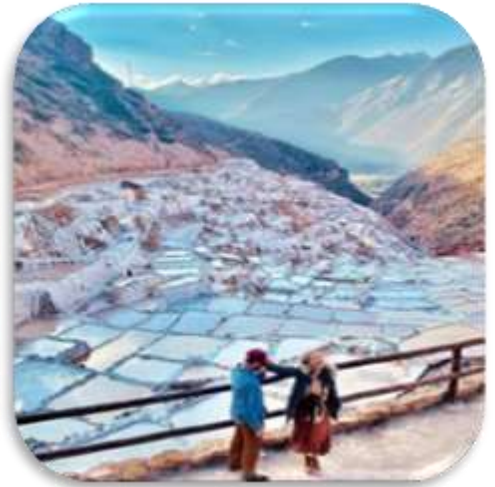
SALT POND OF MARAS