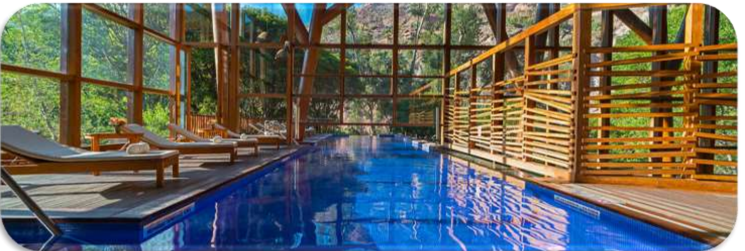
TAMBO DEL INKA, LUXURY COLLECTION, SACRED VALLEY