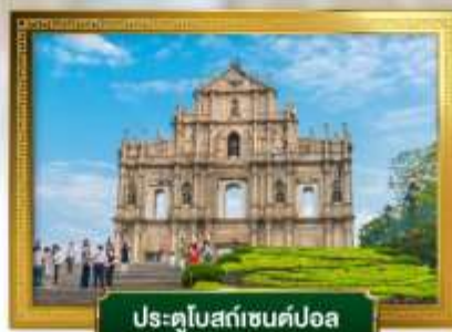
ประตูโบสถ์เซนต์ปอล