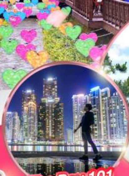
The Bay 101