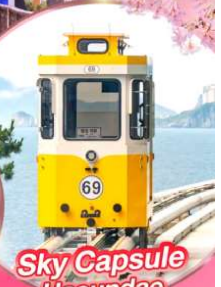
Sky Capsule Haeundae