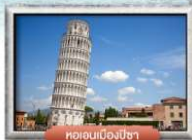
หออนเมืองปิซา

พิเศษ! สปาเกตตี้เส้นหมึกดำ, พิชซ่าสโตร์อิตาเลียนแท้