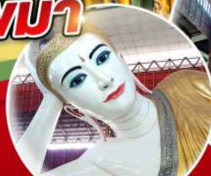
พระนอนตาหวาน