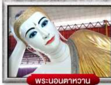
พระนอนศาหาวน