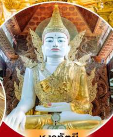
หงาทัตยี