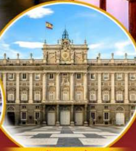
พระราชวังหลวงแห่งมาดริด