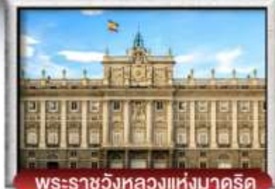
พระราชวังหลวงแห่งมาดริด