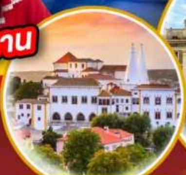
พระราชวังแห่งชาติซินตรา