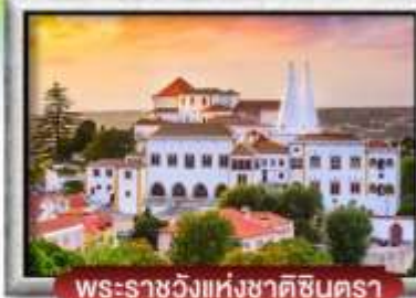
พระราชวังแห่งชาติซินตรา