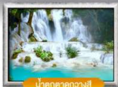
น้ำตกตาดกวางสี