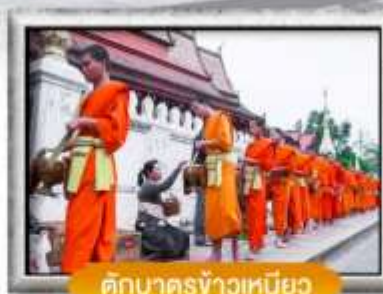
ตักบาตรข้าวเหนียว