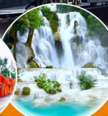
น้ำตกตาดกว้างสี