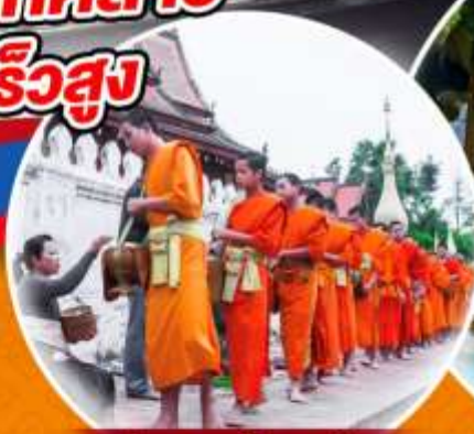
ดักบาตรข้าวเหนียว

เวียงจันทน์ วังเวียง กุ้ยหลินแห่งเมืองลาว