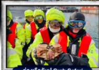
ส่องเรือจับปู Crab Safari