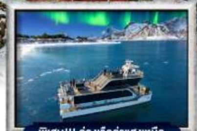
พิเศษ!!! ส่องเรือลำแสงเหนือ

บินทรู สายการบิน Full Service | พิเศษ! บุฟเฟต์ซีฟู้ด