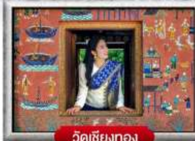
วัดเชียงทอง