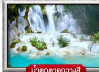
น้ำตกตาดกวางสี