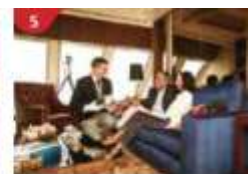
The Palace Indulge in European-style butler service and exclusive facilities.