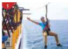
Ropes Course & Zipline Feel the thrill of gliding above the ocean on a 35-metre zipline.