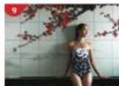
Crystal Life™ Spa Rejuvenate mind, body and soul with our holistic Western and Asian spa experience.