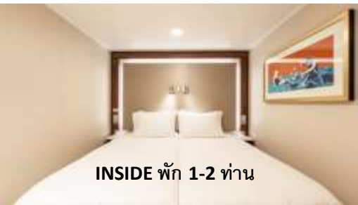
INSIDE พัก 1-2 ท่าน