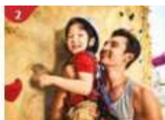
Rock Climbing Wall Challenge yourself on our mountainous rock climbing wall.