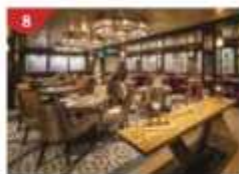
Bistro By Mark Best Relish contemporary Western cuisine from the internationally-acclaimed Australian chef.