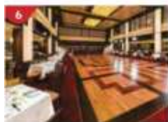
Dream Dining Room Savour a wide variety of Asian and international cuisine.