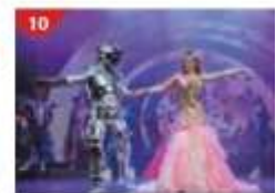
Zodiac Theatre Enjoy live production shows from the acclaimed award-winning entertainment team.