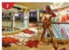
Johnnie Walker House™ Immerse yourself in the intricate world of premium Scotch whisky.