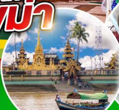
เจดีย์เยเลพญา