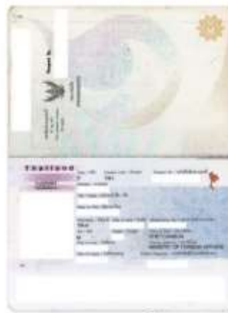
หมายเหตุ : สแกนสีเท่านั้น