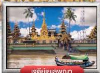
เจดีย์เยเลพญา